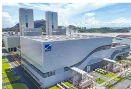
图：珠江 LNG 二期电厂

科学制定发售电策略，持续提升电力交易优化空间、提升机组出力和效益。紧跟电力现货市场，优化交易策略，售电均价优于市场平均水平。发挥煤电联营优势，根据煤炭价格变化调整燃煤结构，加大进口煤、高经济性煤种的掺烧力度，进一步降低燃煤成本。发挥气电联营优势，加强天然气市场形势分析，抓住