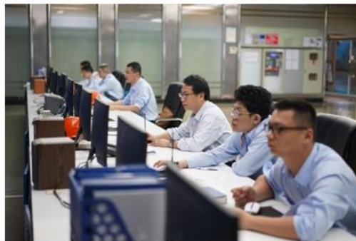
图：珠江电厂运行人员迎峰度夏期间机组监盘。

安全水平稳步提升。 统筹安全和发展，层层强化安全主体责任落实，扎实开展安全生产治本攻坚、“三外”安全管理整治等专项行动，全面强化双重预防机制建设和安全管理数字化转型。上半年，安全隐患排查整治取得成效，重大危险源安全风险可控，未发生一般及以上生产安全事故，截至6月末，实现安全生产连续运行5,854天。