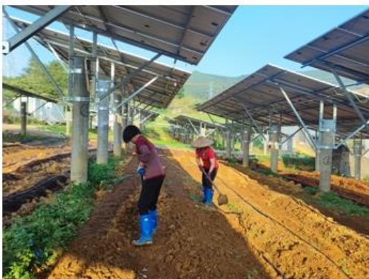
图：福岭小学光伏板下食用菌种植

村振兴活动，募集 35.4 万元定向用于原建档立卡贫困户、边缘困难户、监测帮扶户改善生产生活条件以及乡村产业和灾后重建等项目。三是深化劳务协作。公司属下企业为蕉岭地区提供用工岗位，招聘符合条件的人才参与新能源项目施工及场站的日常运营和维保等工作。