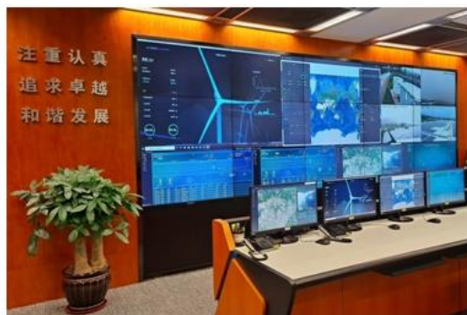
图：新能源集团集中智能运营中心

创新驱动提质焕新。 上半年组织实施研发项目 644 项，“首台套”重大技术装备项目取得阶段性成果，“从化明珠工业园多元互动多能协同示范工程”获评“2024 能源互联网最佳实践案例”。广州发展研究院围绕技术研发、技术服务、数智赋能等领域，强化院企协同联动，推动建设新能源智管平台、配煤掺烧协同创新平台、智慧工程安全管控系统等项目，自主开展技术监督工作，覆盖 22 家电力企业，机组容量超 350 万千瓦。