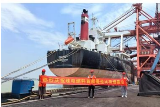
图：珠电燃料公司首船哥伦比亚煤靠泊

时机采购有价格优势的现货气，有效降低燃机发电成本；精心制定机组检修方案，提升机组可靠性，获取容量电费接近100%。报告期内合并口径火力发电企业完成发电量87.29亿千瓦时，上网电量82.76亿千瓦时，同比增长4.39%和5.37%。