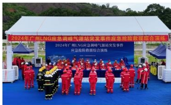
图：2024年广州LNG应急调峰气源站突发事件应急抢险救援综合演练

公司全资及控股企业均制定了突发环境事件应急预案。预案涉及总则、应急处置基本原则、事件类型和危害程度分析、应急指挥组织机构及职责、预防及预警、应急信息报告、应急处置、应急响应分级、处置措施、现场恢复、结束应急、信息上报、应急保障、培训及演练、奖励与处罚等内容。针对各自污染源的的特殊性，还制定了危险化学品泄漏应急预案、突发环境