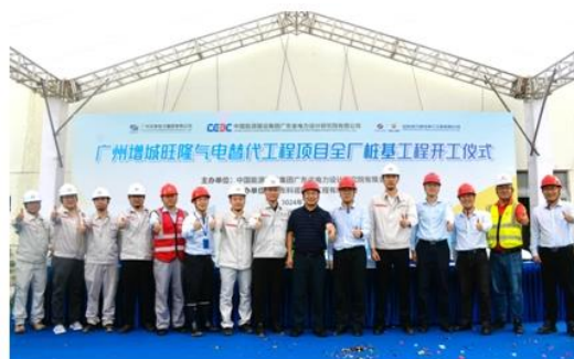
图：广州增城旺隆气电替代项目 举行全厂桩基工程开工仪式

库项目通过竣工验收，配套码头具备靠泊 17.5 万立方米 LNG 船舶条件，储气库二期项目积极筹备前期工作。广州市天然气利用四期工程中新知识城能源站配套管线实现太平能源站稳定供气，珊瑚门站—田心调压站管线加快建设“最后一公里”。珠江电厂等容量替代项目全力推进，争取年内取得核准批复。旺隆气电替代工程完成烟囱拆除及新建石膏脱水楼封顶工作，配套燃气管线项目完成设计、招标等工作。广州金融城综合能源项目交通枢纽冷站完成设备安装，东区冷站完成立项，力争年内供冷。