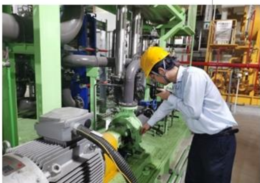
图：操作员日常巡检

珠江电厂的除尘设施投运率为 100%，除尘效率为 99.91%；脱硫设施投运率为 100%，脱硫效率为 97.85%；脱硝投运率为 99.64%，脱硝效率为 87.03%；中电荔新公司的除尘设施投运率为 100%，除尘效率为 99.99%；脱硫设施投运率为 100%，脱硫效率为 97.79%；脱硝投运率为 99.80%，脱硝效率为 91.81%；恒益热电公司的除尘设施投运率为 100%，除尘效率为 99.90%；脱硫设施投运率为 100%，脱硫效率为