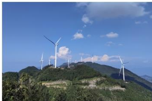
图：电力集团重庆南川香树岭风电场 风机叶片在蓝天下舞动

广州发展围绕“将集团公司建设成为国内领先的绿色低碳综合智慧能源企业集团”的战略目标，积极推动产业布局从清洁能源为主向绿色低碳能源为主转变，投资建设天然气发电设施，持续加大新能源业务发展规模，绿色低碳能源装机占比超过 67%，强化电力、天然气、煤炭、油品供应与储运的清洁化、绿色化、低碳化水平；2024 年上半年，风力和光伏发电量 33.45 亿千瓦时，减排二氧化碳 299 万吨、二氧化硫 365 吨、氮氧化物 540 吨、烟尘 79 吨。