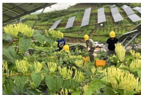
图：连州星子光伏电站金银花种植迎来收获季。

3. 构建特色新能源生态圈。打造新能源“风光储充运”一体化产业链，深耕华南、优拓全国，实行规模化、区域化发展。在智能运维、系统集成、技术创新、降本增效等方面拥有丰富的经验。“新能源+农林渔”新业态发展自成特色，拓展价值链延伸。作为新能源“链主”企业，构建市国资产业联盟，与产业链龙头企业形成战略合作。项目储备丰富，二级集团、绿色低碳产业基金多主体发力，加速实现新能源产业规模化、特色化发展。