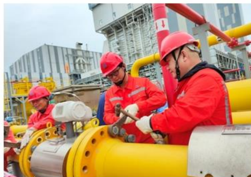
图：计量设备技术改造现场

把握市场机遇，适时采购现货气，积极筹措有竞争力气源。统筹多路气源，探索批发业务新模式，天然气批发量近 8 亿立方米，同比增长 16%。做大做强城燃业务，新发展居民用户 7 万户，非居民用户 1,400 多户。挖掘周边城区潜在用气需求，惠州、佛山等异地市场售气量达 1.5 亿立方米。推进与清远、中山等地高压管网互联互通，提升管网输气能力利用率。稳步延伸增值服务，燃气保险、燃气具销售总额近 4,000 万元。报告期内管道燃气及 LNG 销售量 18.82 亿立方米，同比增长 25.95%。