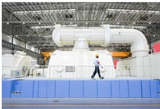
图：南沙电力公司生产现场

广州发展积极发展清洁能源项目，投资建设天然气 9H 级发电机组、分布式能源站及风力发电、光伏发电等新能源项目，生产场所的废水排放、固体废物、噪声排放均符合相关法律法规要求。清洁能源项目建成投产后可大量节约煤炭资源的使用，减少二氧化碳、二氧化硫、氮氧化物和粉尘等污染物的排放。