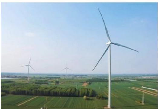
图：河北大康风脉风电场

产业战略布局点、线、面全面推进，业务拓展到国内 17 个省份。新增腾格里风电项目，实现内蒙古新能源项目“零”的突破；云南禄劝、上思华兰等光伏项目投产发电；战略布局户用分布式光伏发展，首批项目启动招标；大力推进大型抽水蓄能项目开发；绿色低碳产业基金项目储备规模达 350 万千瓦，首批投资中两个项目实现并网发电；绿色权益保值增值，完成绿证交易 421 万张；成立生态农业科技公司，打造“新能源+”融合发展业态，充分挖掘土地价值。充电设施网络进一步完善，装机规模达 51MW，自有充电平台用户和充电量稳步增长。报告期内完成发电量 33.45 亿千瓦时，上网电量 32.68 亿千瓦时，同比增长 41.11%和 40.74%。