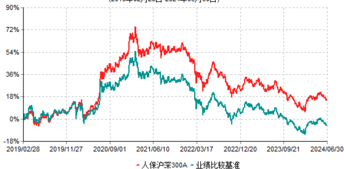
人保沪深300A累计净值增长率与业绩比较基准收益率历史走势对比图 (2019年02月28日-2024年06月30日)