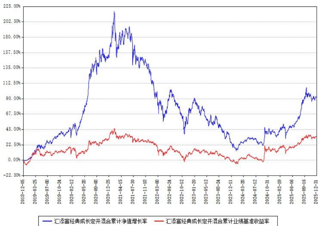
汇添富经典成长定开混合累计净值增长率与同期业绩基准收益率对比图

注：本基金建仓期为本《基金合同》生效之日（2018年12月05日）起6个月，建仓期结