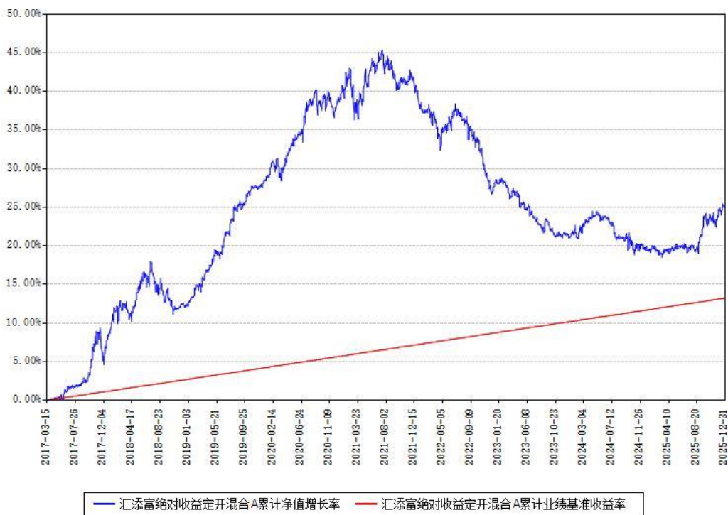
汇添富绝对收益定开混合A累计净值增长率与同期业绩基准收益率对比图