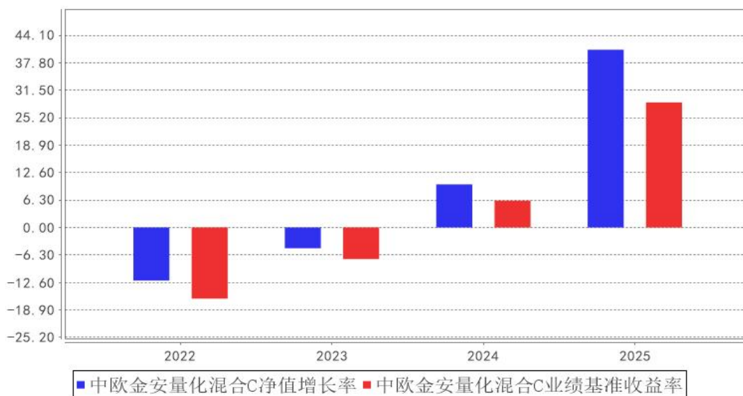
中欧基金安量化混合C基金每年净值增长率与同期业绩比较基准收益率的对比图

注：本基金合同生效日为 2022 年 1 月 20 日，2022 年度数据为 2022 年 1 月 20 日至 2022 年 12 月 31 日数据。