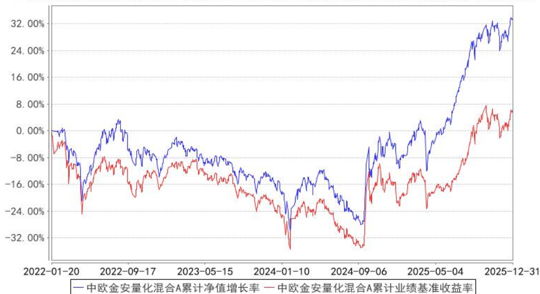
中欧金安量化混合A累计净值增长率与同期业绩比较基准收益率的历史走势对比图