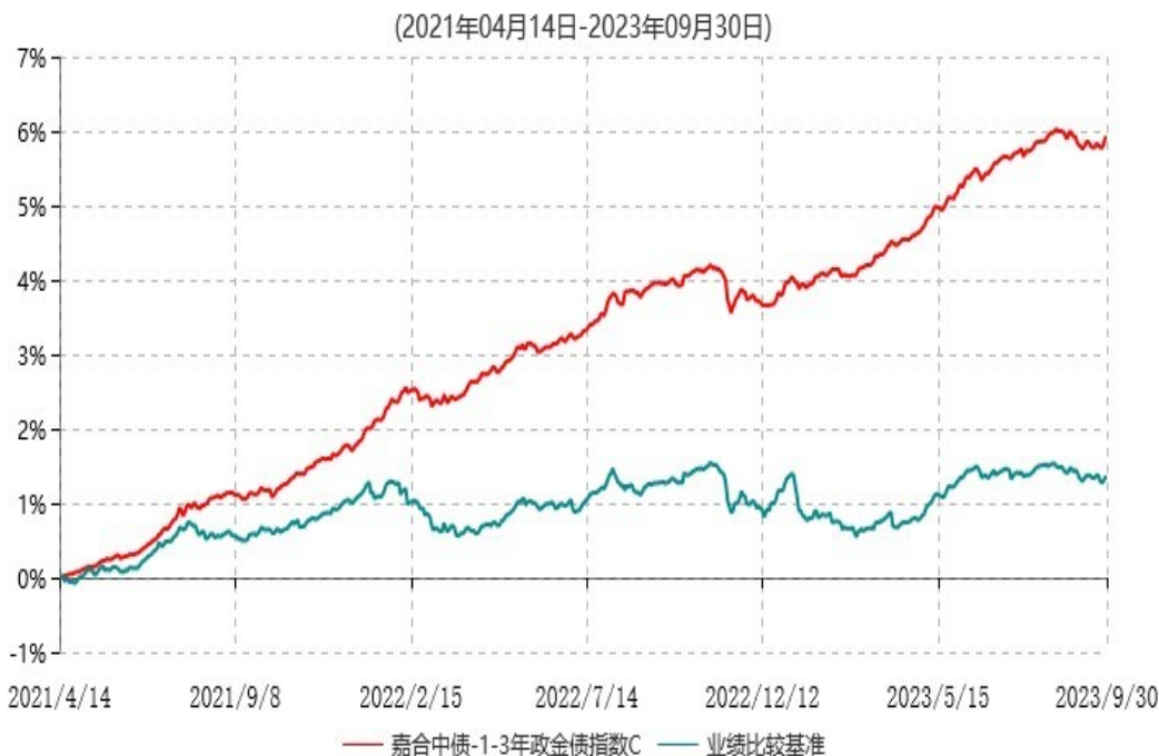
嘉合中债-1-3年政金债指数C累计净值增长率与业绩比较基准收益率历史走势对比图