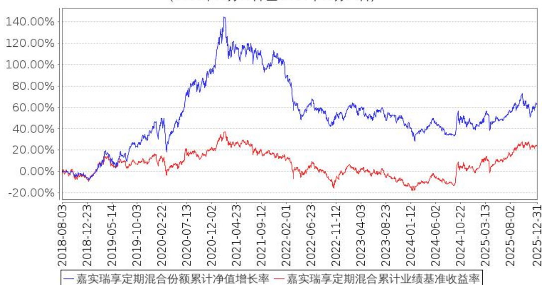
嘉实瑞享定期混合份额累计净值增长率与同期业绩比较基准收益率的历史走势对比图 (2018年08月03日至2025年12月31日)

注：按基金合同和招募说明书的约定，本基金自基金合同生效日起 6 个月为建仓期，建仓期结束时本基金的各项资产配置比例符合基金合同约定。