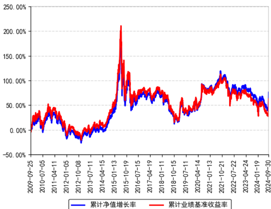
南方中证500ETF联接 (LOF) A 累计净值增长率与同期业绩比较基准收益率的历史走势对比图