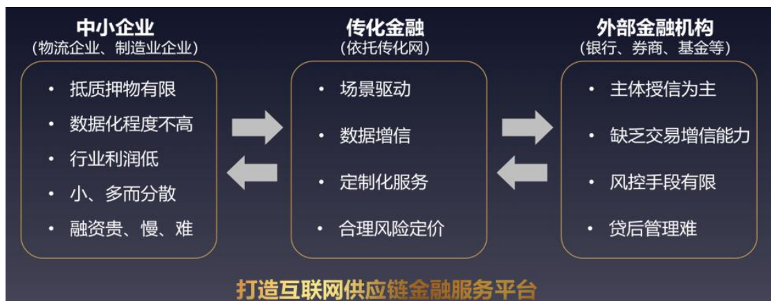
金融服务核心业务产品图示

围绕传化网商流、物流与信息流的综合性服务与数据信息沉淀，以技术为手段、以风控为核心、以数据为驱动，采用平台化的模式开展供应链金融服务。公司利用平台优势，与银联、网联合作，通过交互、链接金融供需方来实现平台交易闭环与物流行业交易大数据沉淀，在增强传化网平台生态粘性的同时，通过支付、供应链金融、保险、理财等业务产品，实现传化网生态价值的变现。