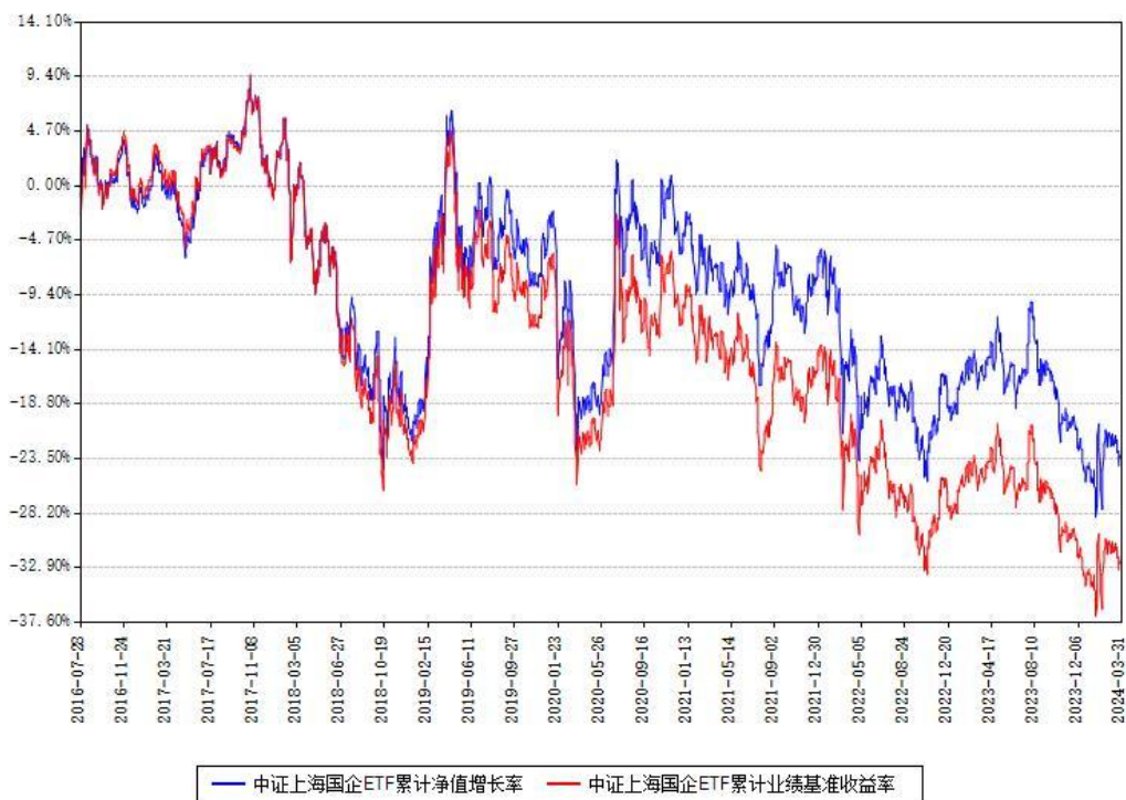
中证上海国企ETF累计净值增长率与同期业绩基准收益率对比图

(二)自基金合同生效以来基金累计净值增长率变动及其与同期业绩比较基准收益率变动的比较图