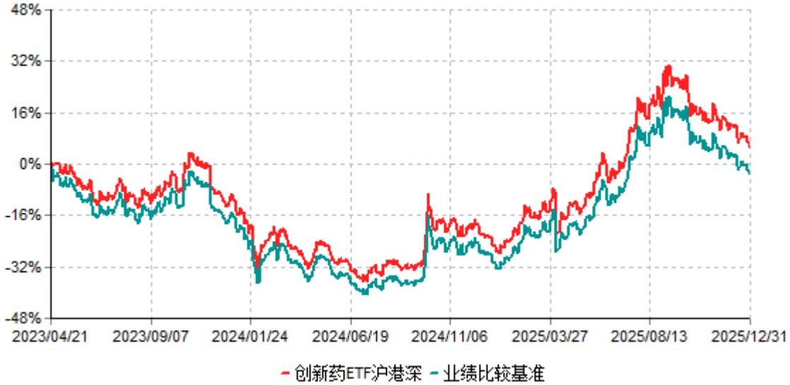
创新药ETF沪港深累计净值增长率与业绩比较基准收益率历史走势对比图 (2023年04月21日-2025年12月31日)