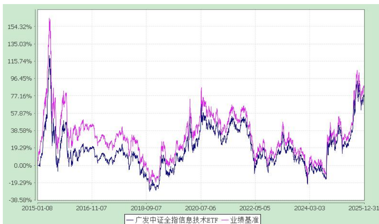
广发中证全指信息技术交易型开放式指数证券投资基金 份额累计净值增长率与业绩比较基准收益率的历史走势对比图 (2015 年 1 月 8 日至 2025 年 12 月 31 日)