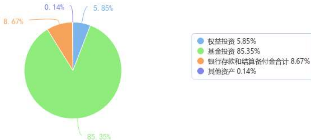
投资组合资产配置图表（数据截至日期：2023年06月30日）