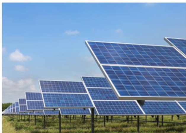
应用场景：光伏发电

新能源变压器主要应用于光伏发电等领域，产品主要包括：配套于光伏逆变器的高频磁性器件、应用于光伏发电电网的升压变压器以及其他电能转换产品。高频磁性器件是光伏逆变器设备储能和能源转换的核心元器件，公司产品具有噪音小，稳定性高等特点，已连续几年为国内知名主流光伏逆变器厂商大批量供应。光伏升压变压器是光伏电站中升压并网的关键器件，公司产品具有转换效率高，稳定性好，恶劣环境适应力强等特点，广泛应用于国内外众多光伏电站。凭借过硬的技术实力、产品质量和规模化的生产能力，公司也是国内较早打入美国、日本、欧盟等主要光伏市场的厂商。