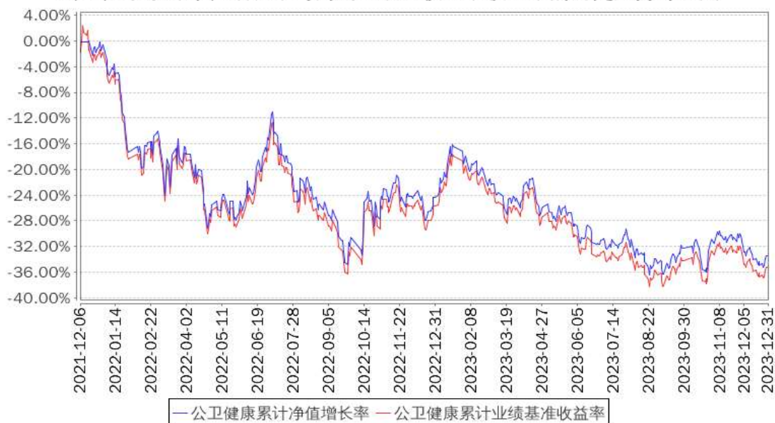
公卫健康累计净值增长率与同期业绩比较基准收益率的历史走势对比图