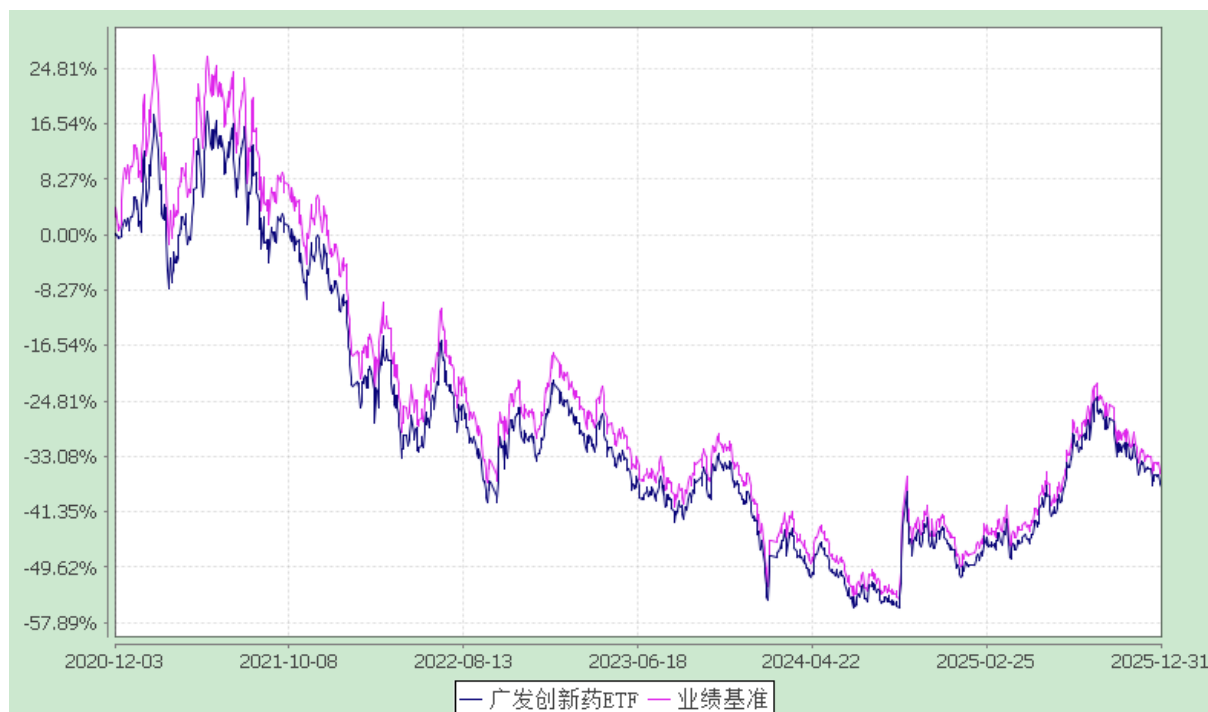
广发中证创新药产业交易型开放式指数证券投资基金 份额累计净值增长率与业绩比较基准收益率的历史走势对比图 (2020 年 12 月 3 日至 2025 年 12 月 31 日)