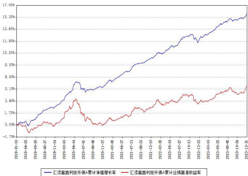
汇添富鑫利定开债A累计净值增长率与同期业绩基准收益率对比图