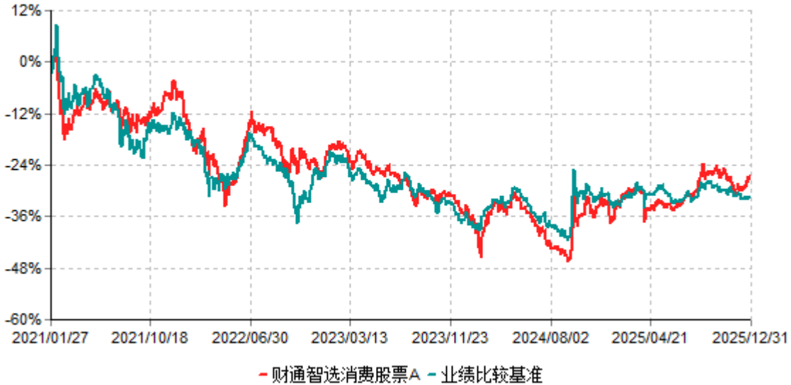
财通智选消费股票A累计净值增长率与业绩比较基准收益率历史走势对比图 (2021年01月27日-2025年12月31日)