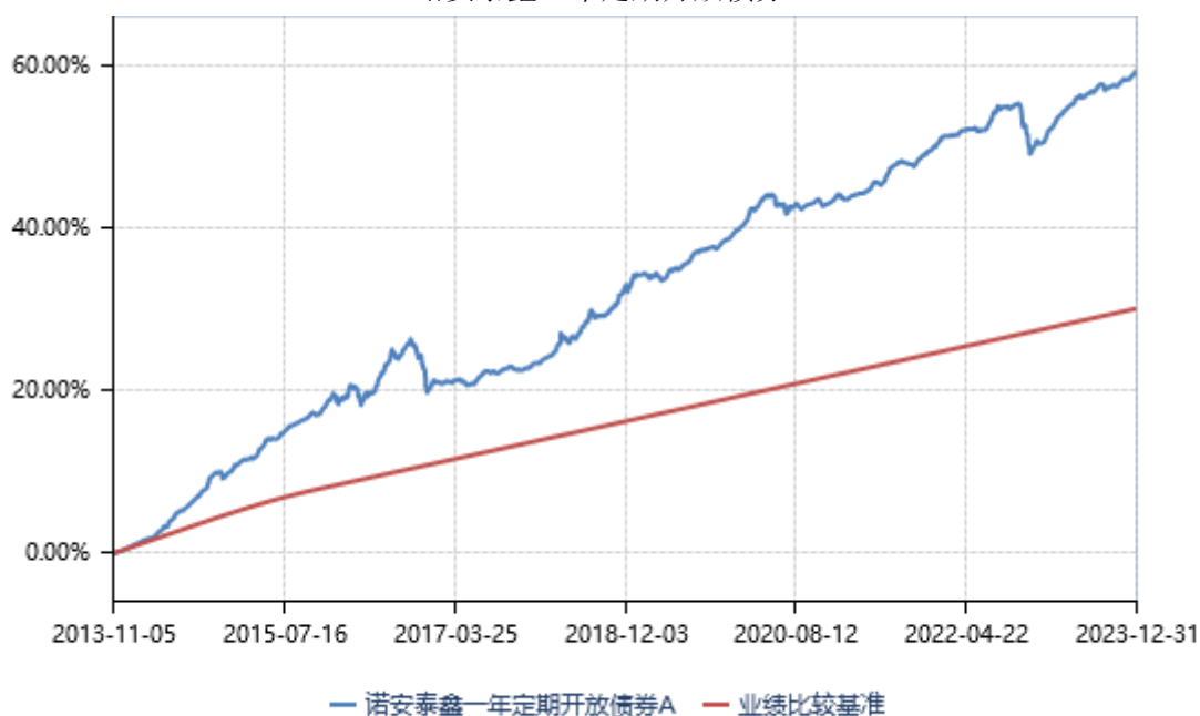
诺安泰鑫一年定期开放债券 A