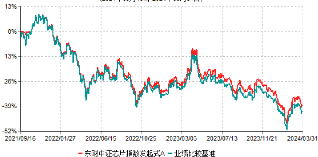
东财中证芯片指数发起式A累计净值增长率与业绩比较基准收益率历史走势对比图 (2021年09月16日-2024年03月31日)