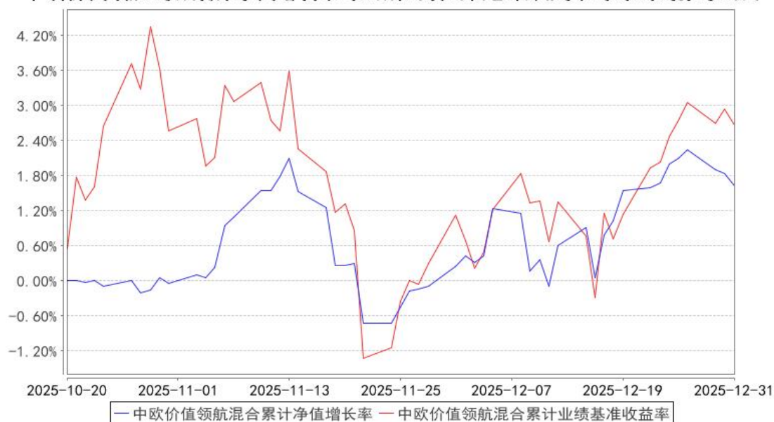
中欧价值领航混合累计净值增长率与同期业绩比较基准收益率的历史走势对比图

注：本基金基金合同生效日期为 2025 年 10 月 20 日，自基金合同生效日起到本报告期末不满一年，按基金合同的规定，本基金自基金合同生效起六个月为建仓期，建仓期结束时各项资产配置比例应当符合基金合同约定。