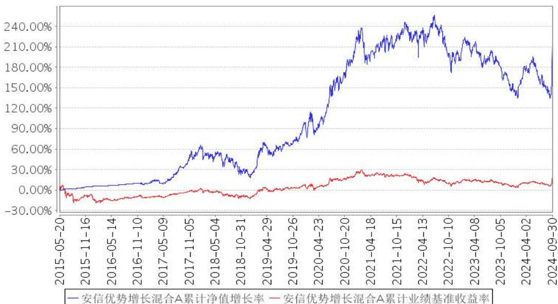
安信优势增长混合A累计净值增长率与同期业绩比较基准收益率的历史走势对比图