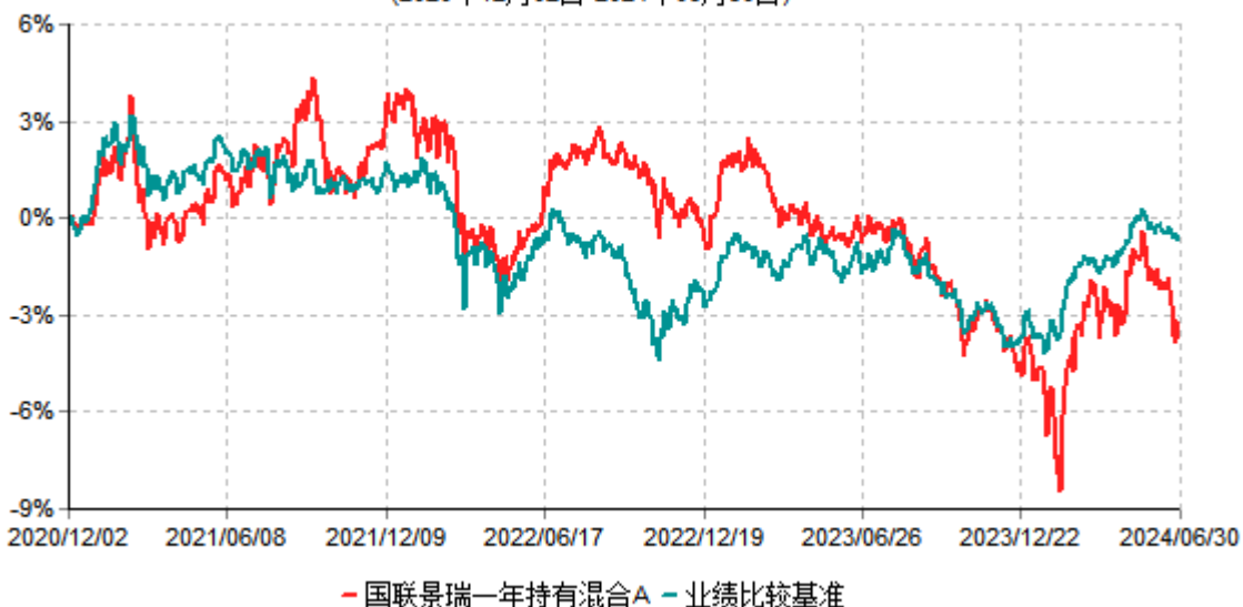
国联景瑞一年持有混合A累计净值增长率与业绩比较基准收益率历史走势对比图 (2020年12月02日-2024年06月30日)