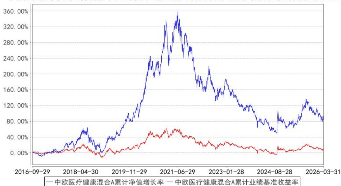
中欧医疗健康混合A累计净值增长率与同期业绩比较基准收益率的历史走势对比图