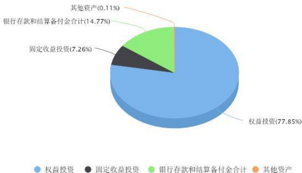
投资组合资产配置图表 数据截止日期:2024年03月31日