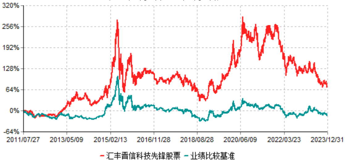
汇丰晋信科技先锋股票型证券投资基金累计净值增长率与业绩比较基准收益率历史走势对比图 (2011年07月27日-2023年12月31日)