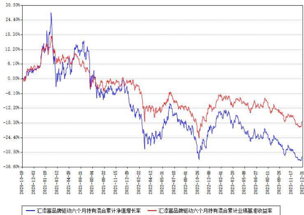
汇添富品牌驱动六个月持有混合累计净值增长率与同期业绩基准收益率对比图

注：本基金建仓期为本《基金合同》生效之日（2020年10月19日）起6个月，建仓期结束时各项资产配置比例符合合同约定。