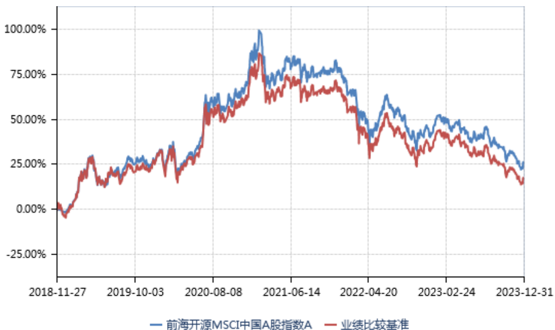
前海开源 MSCI 中国 A 股指数 C