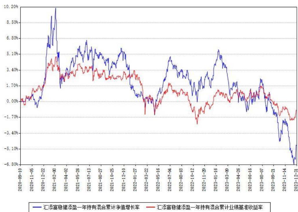
汇添富稳健添盈一年持有混合累计净值增长率与同期业绩比较基准收益率对比图

注：本基金建仓期为本《基金合同》生效之日（2020年09月10日）起6个月，建仓期结束时各项资产配置比例符合合同约定。