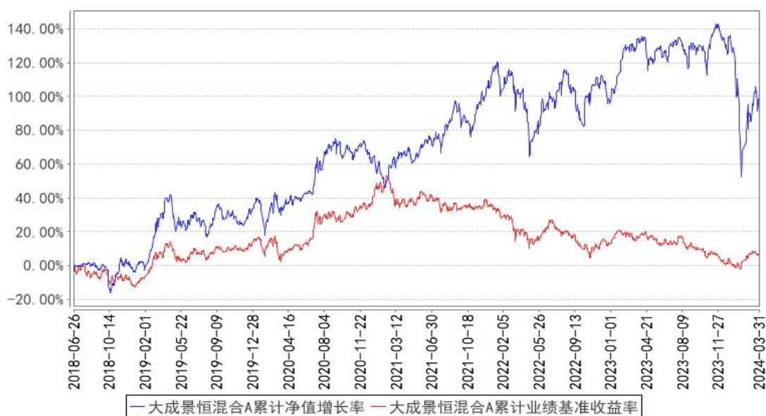
大成景恒混合A累计净值增长率与同期业绩比较基准收益率的历史走势对比图