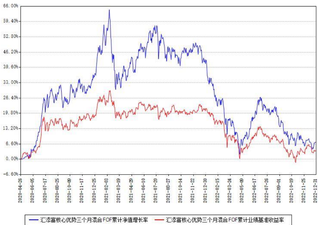
汇添富核心优势三个月混合FOF累计净值增长率与同期业绩基准收益率对比图