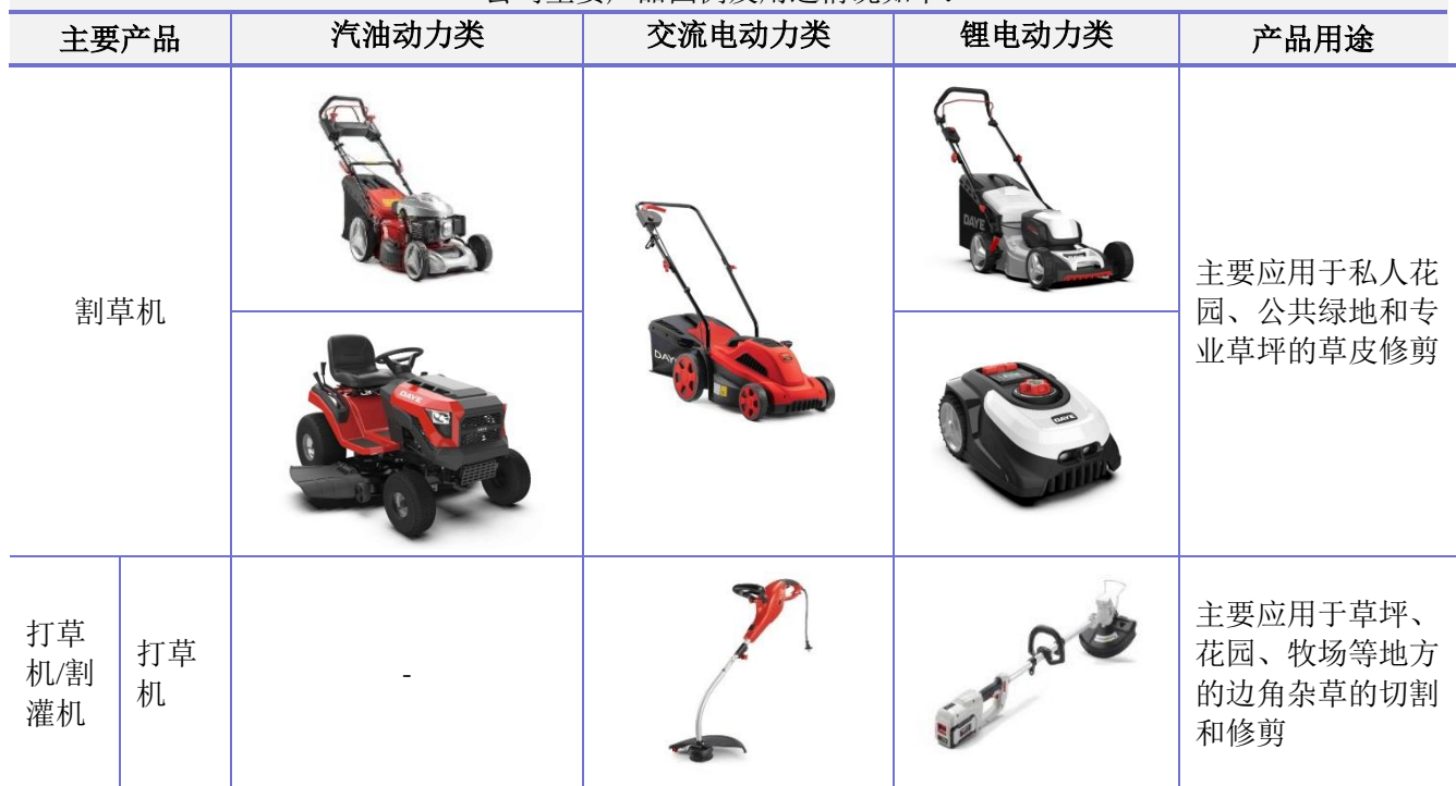
公司主要产品图例及用途情况如下：