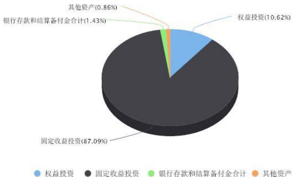
投资组合资产配置图表 数据截止日期:2023年06月30日