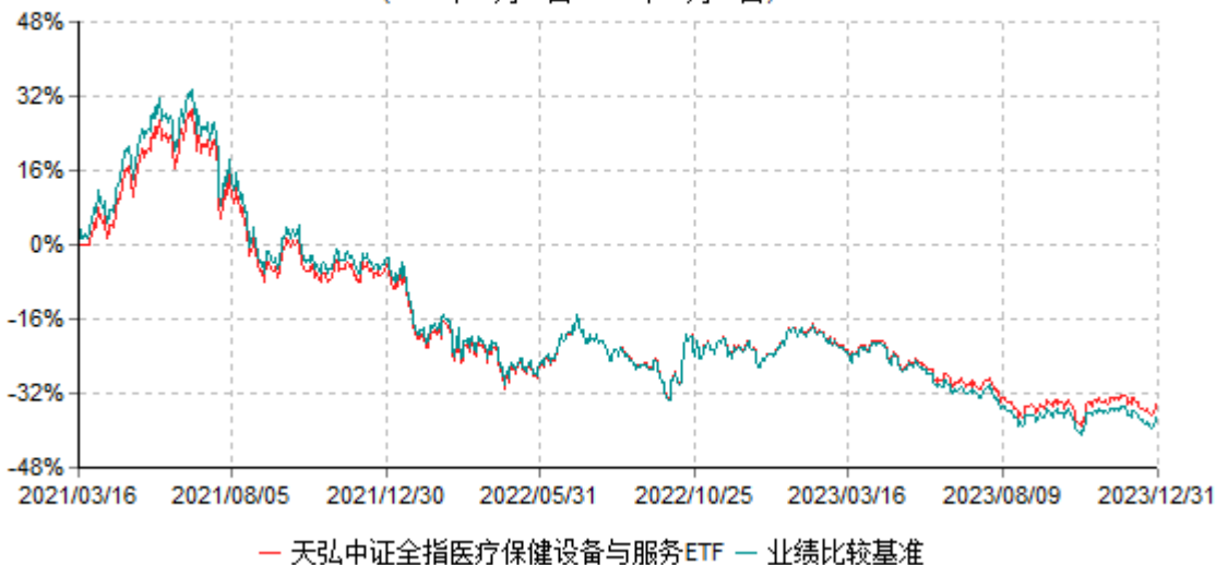
天弘中证全指医疗保健设备与服务交易型开放式指数证券投资基金累计净值增长率与业绩比较基准收益率历史走势对比图 (2021年03月16日-2023年12月31日)

注：1、本基金合同于2021年03月16日生效。 2、本报告期内，本基金的各项投资比例达到基金合同约定的各项比例要求。