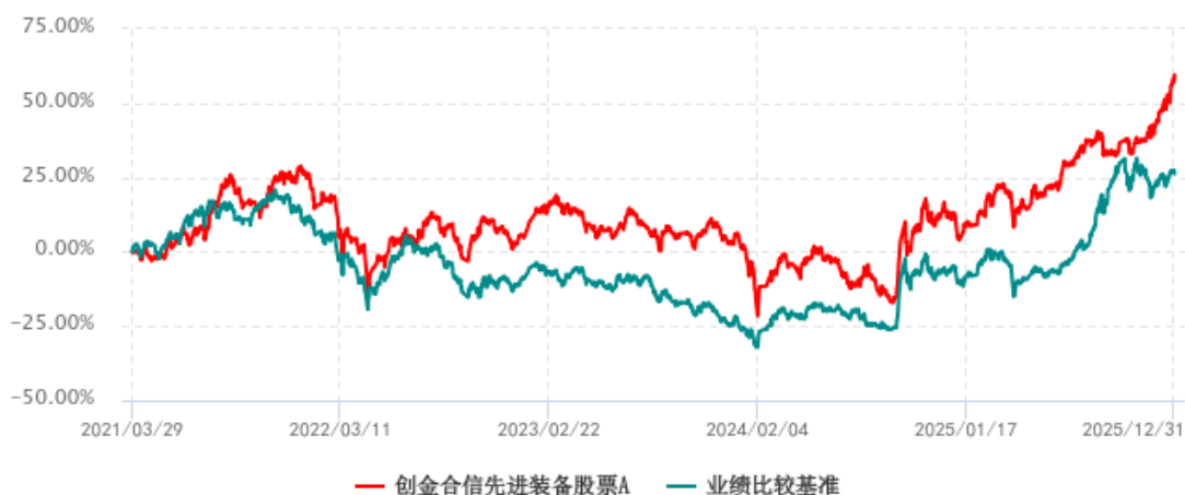
创金合信先进装备股票A累计净值增长率与业绩比较基准收益率历史走势对比图 (2021年03月29日-2025年12月31日)