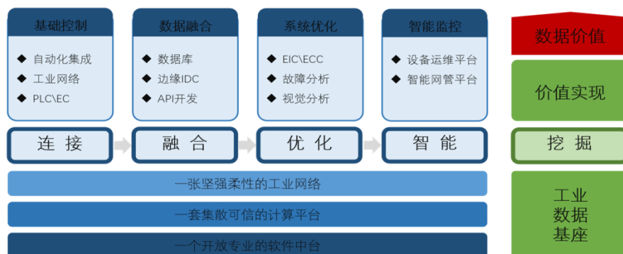
工业信息化业务发展战略