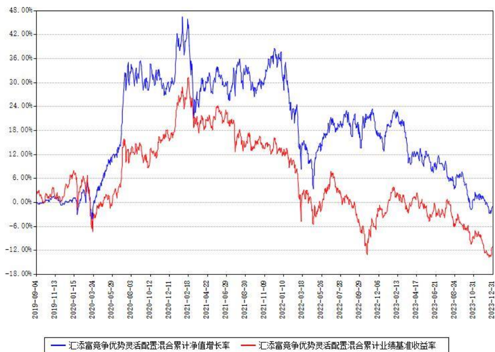
汇添富竞争优势灵活配置混合累计净值增长率与同期业绩基准收益率对比图

注：本基金建仓期为本《基金合同》生效之日（2019年09月04日）起6个月，建仓期结束时各项资产配置比例符合合同约定。