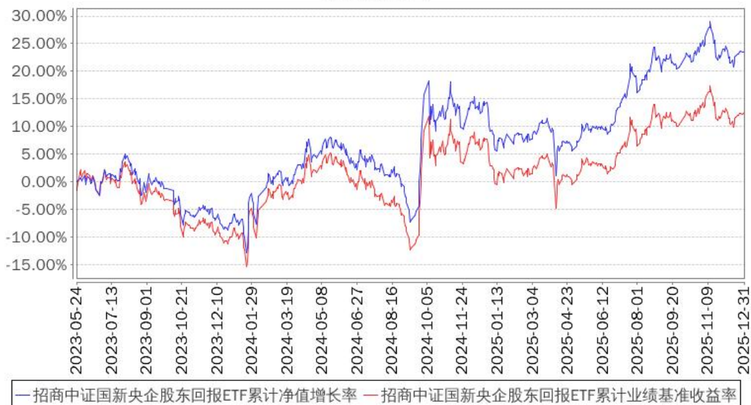
招商中证国新央企股东回报ETF累计净值增长率与同期业绩比较基准收益率的历史走势对比图