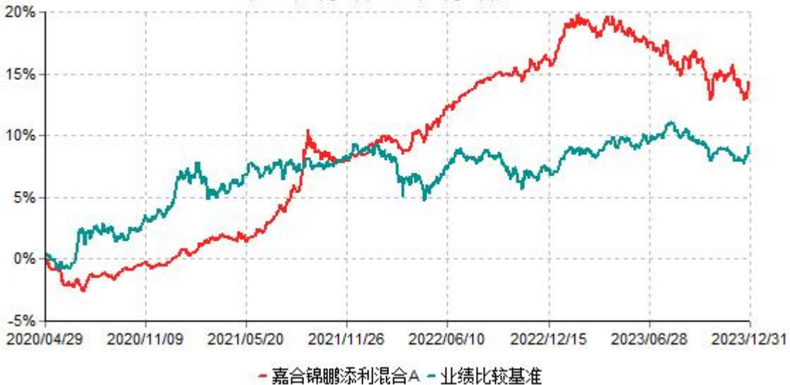
嘉合锦鹏添利混合A累计净值增长率与业绩比较基准收益率历史走势对比图 (2020年04月29日-2023年12月31日)