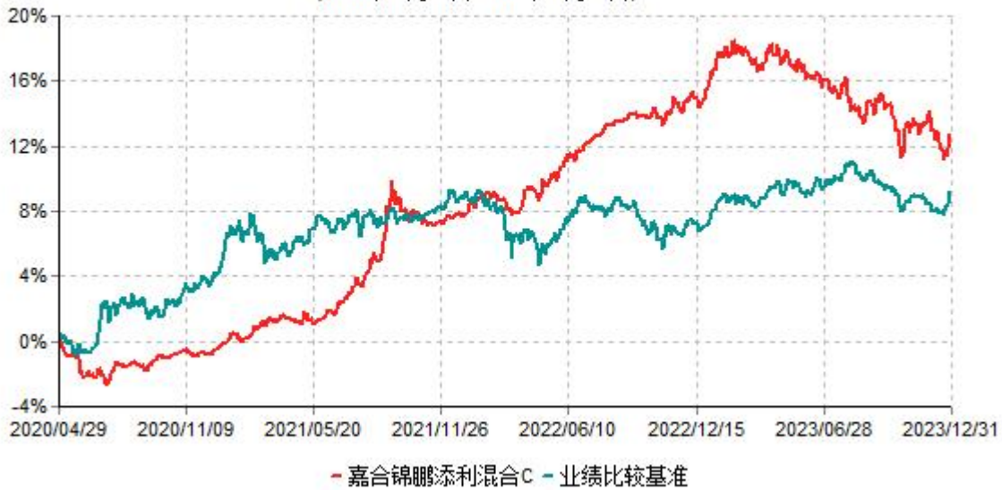
嘉合锦鹏添利混合C累计净值增长率与业绩比较基准收益率历史走势对比图 (2020年04月29日-2023年12月31日)