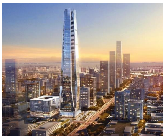
图7：NCC钢结构应用于超高层建筑