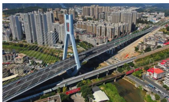
图10：NCC钢结构应用于公路跨线桥