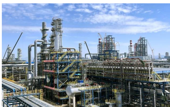
图9：NCC钢结构应用于石油化工领域