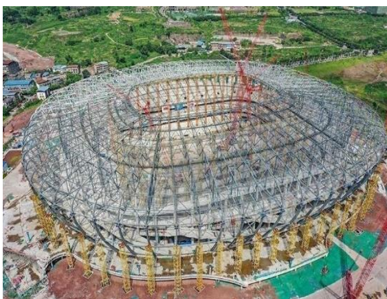
图8：NCC钢结构应用于体育场馆