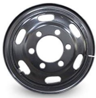
图1：型钢钢轮（适用于特殊路况重载车型）

报告期内，公司汽车车轮业务的主要产品为型钢钢轮、轻量化无内胎钢轮和锻造铝合金轮毂，这些产品广泛应用于国内外客车、货车、牵引车、微卡、特种车辆等商用车领域。公司目前拥有厦门、四川南充、越南、漳州华安、唐山曹妃甸 5 个地区 7 个车轮生产基地，产品链齐全，可满足国内外整车厂和售后市场客户各种需求，“日上”车轮已经成为国内领先的车轮品牌。