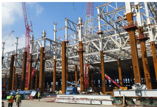
图5：NCC钢结构应用于大型工业厂房