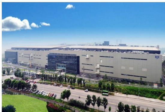
图6：NCC钢结构应用于高端电子厂房