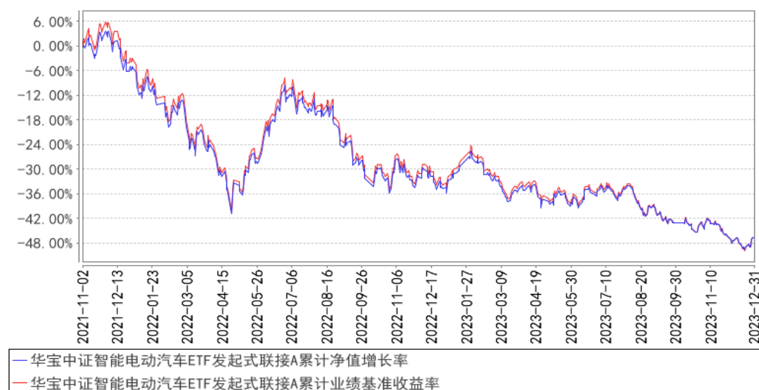
华宝中证智能电动汽车ETF发起式联接A累计净值增长率与同期业绩比较基准收益率的历史走势对比图