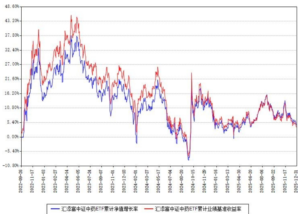
汇添富中证中药ETF累计净值增长率与同期业绩基准收益率对比图

注：本基金建仓期为本《基金合同》生效之日（2022年09月26日）起6个月，建仓期结束时各项资产配置比例符合合同约定。