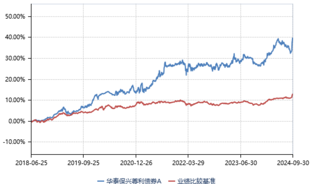
华泰保兴尊利债券 A