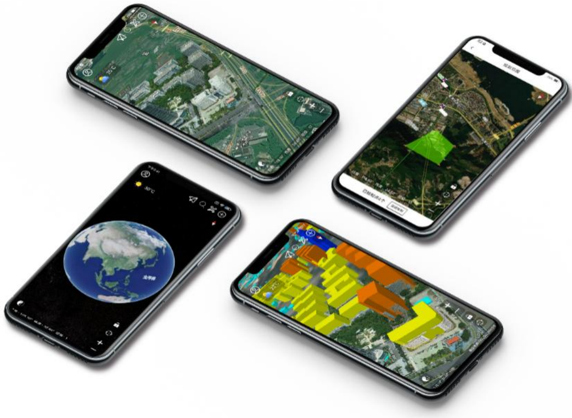
图 1 精图地球 APP