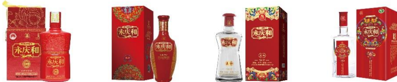
互助青稞酒 (永庆和祥和)