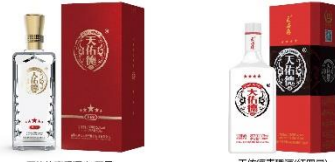
天佑德青稞酒(红五星)