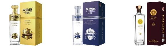
天佑德青稞酒(第三代金标出口型)