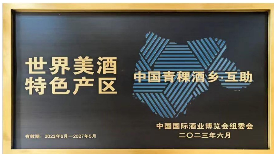
- 世界美酒特色产区 中国青稞酒乡·互助 授牌 -