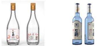
互助青稞酒 (白青稞)