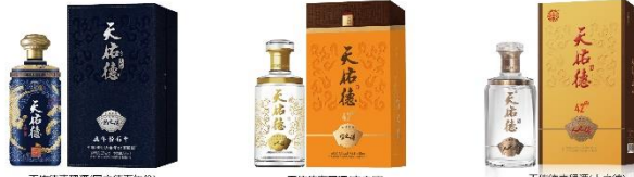
天佑德青稞酒(国之德真年份)