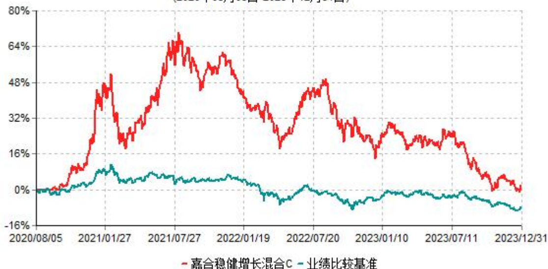
嘉合稳健增长混合C累计净值增长率与业绩比较基准收益率历史走势对比图 (2020年08月05日-2023年12月31日)