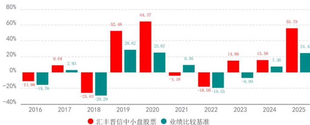
基金的过往业绩不代表未来表现，数据截止日：2025年12月31日