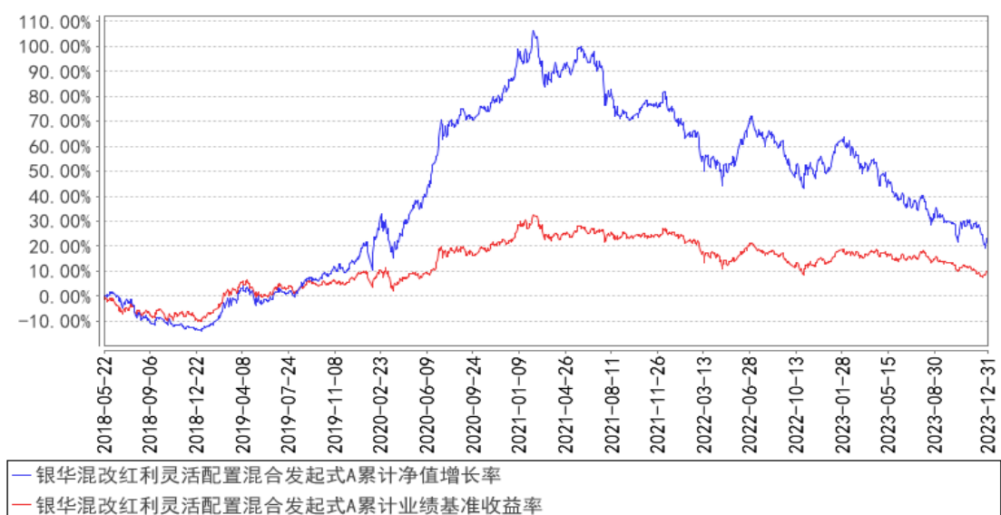
银华混改红利灵活配置混合发起式A累计净值增长率与同期业绩比较基准收益率的历史走势对比图