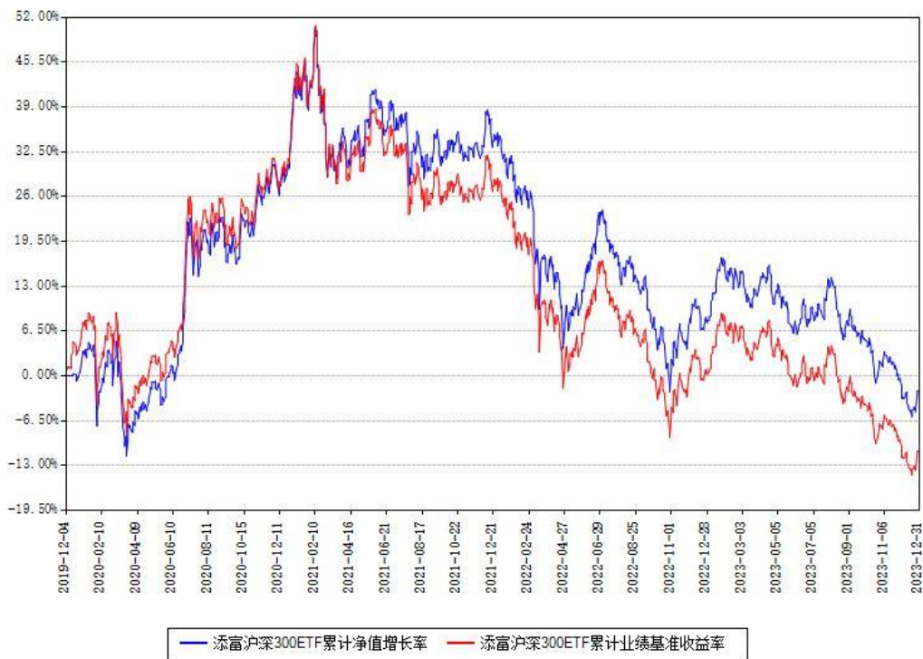
添富沪深300ETF累计净值增长率与同期业绩比较基准收益率对比图

注：本基金建仓期为本《基金合同》生效之日（2019年12月04日）起6个月，建仓期结束时各项资产配置比例符合合同约定。