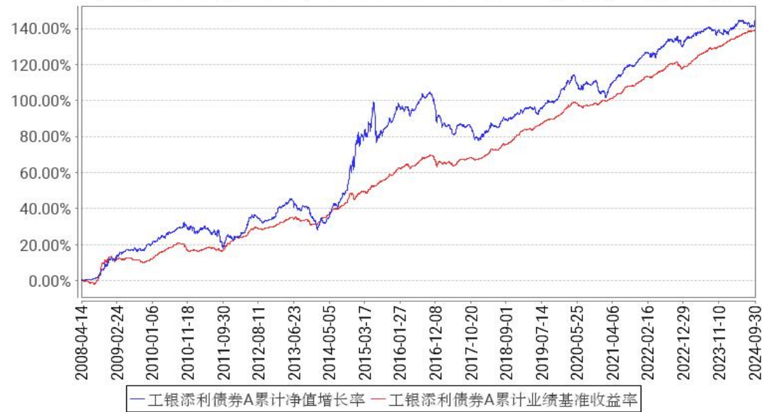
工银添利债券A累计净值增长率与同期业绩比较基准收益率的历史走势对比图